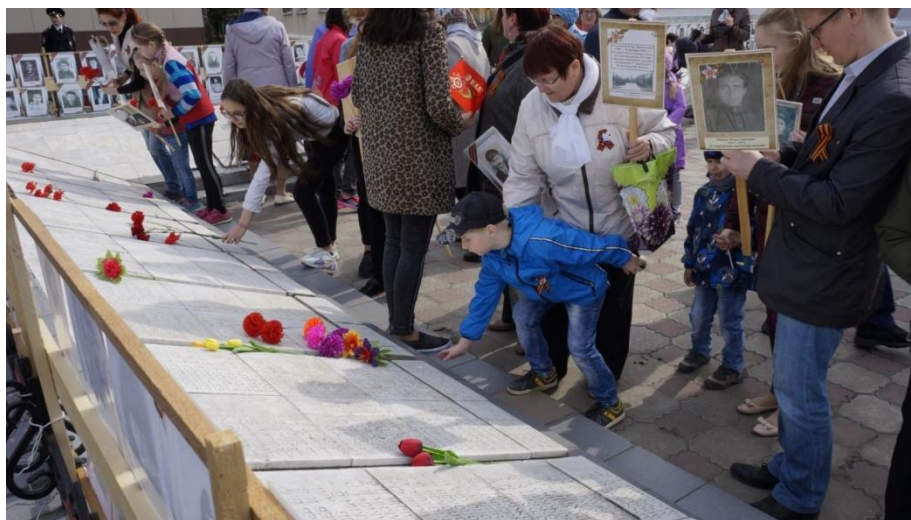
У плиты с именем прапрадедушки памятника воину-освободителю в Седельниково