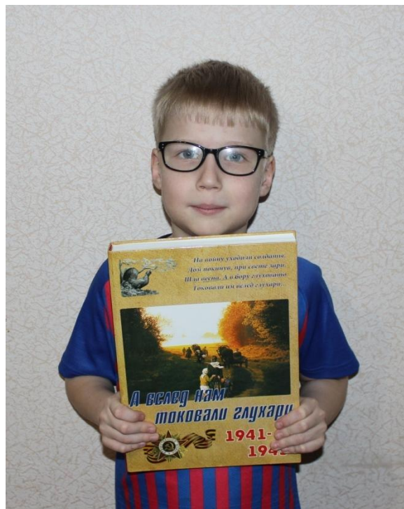
Очерки о моих родных в книге «А вслед нам токовали глухари»