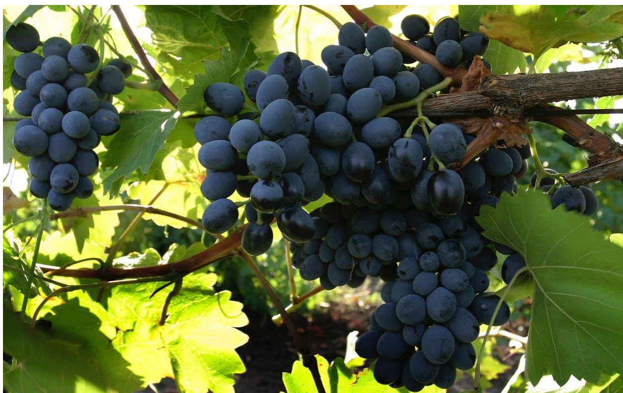
Гроздь винограда Бакон Молдова

Ранее я упоминала, что родом с севера Молдавии из села Шапте-Бань (Семь Копеек - молд.).