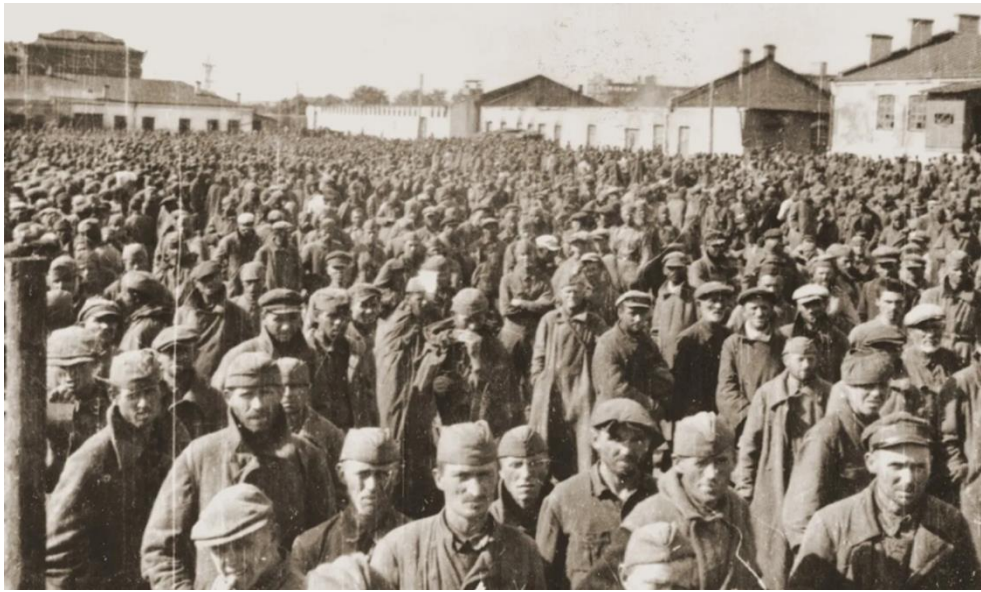
Советские военнопленные в шталаге VIII Е. Осень 1941 г.

Но прадеду повезло. Он не умер от голода и холода, не был убит охранниками. В апреле 1942 года (в другом протоколе допроса – летом 1942 года) его перевозят в город Махтенбург (в других протоколах допросов – Мехтенбург, Махитенбург) на земляные работы, а летом 1944 года (в других протоколах допросов – осенью 1944 года) – в Ашенберг.