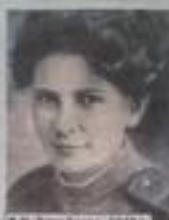
В.П. Тимофеева, 1943 г.

На официальном сайте администрации Балашовского муниципального района в рамках проекта «К 70-летию Великой Победы» размещены материалы биографии, фотографии, участника Великой Отечественной войны Вера Павловна Тимофеева.