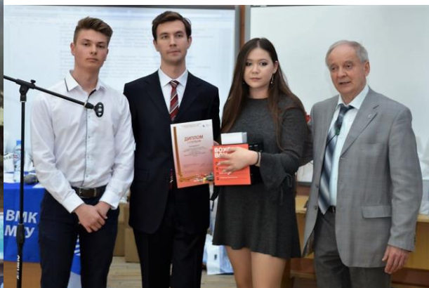
Москва, МГУ, 2019 г.