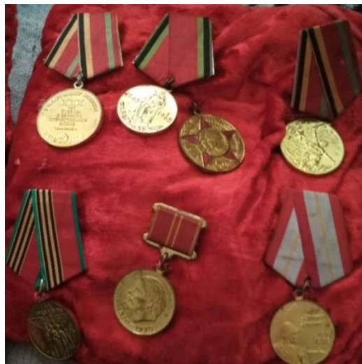
Награды Афанасия Яковлевича - семейная реликвия Талакиных