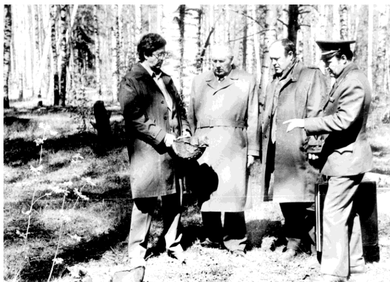
3_Курганская делегация в ржевском лесу