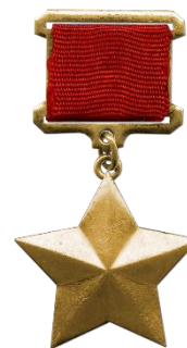
Орден Ленина и медаль Золотая Звезда