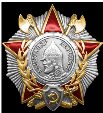
Орден Александра Неского