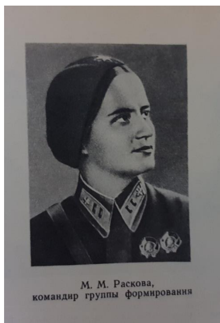
Книги из архива библиотеки ССЭИ им. Г.В. Плеханова (г. Саратов)