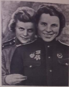
Герои Советского Союза Евгения Руднева, штурман полка (слева), и Елдокия Никулина, командир эскадрильи