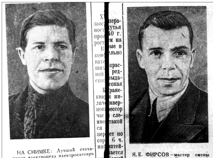
НА СНИМКЕ: Лучший стахановец электроцеха электрослесарь