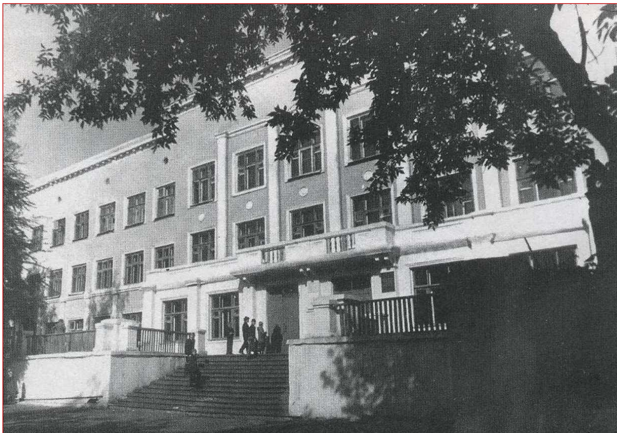
СРЕДНЯЯ ШКОЛА № 19 г. КЕМЕРОВО (1941г.)