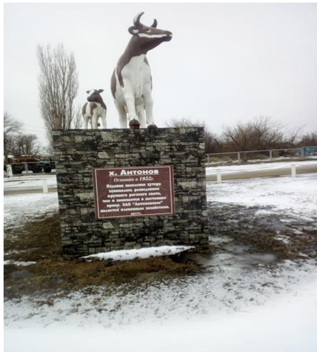
Памятник на въезде в хутор