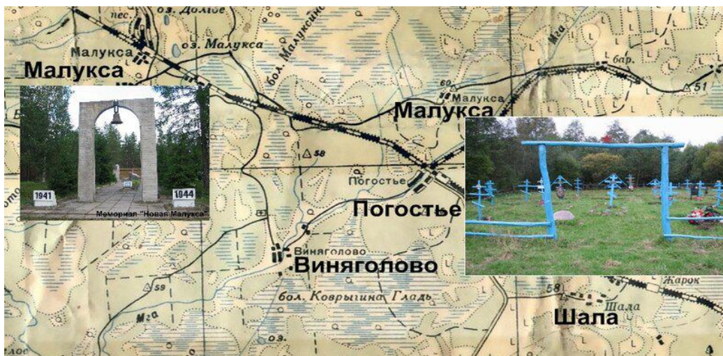
Рисунок № 6. Братское воинское захоронение дер. Погостье ст. Новая Малукса