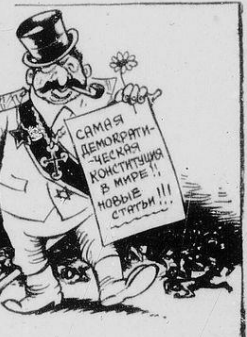
По рис. О. Осве

«Советский дом» систематично издает широкие возможности для послышек под его крышей новых жильцов, новых гласных — провозглашает «Берлинский Бюро Цейтунг». По плану Москвы и ее союзников, народы Европы, заплатив, таким образом, немую дань существованию Сталина, должны в конце концов в руках оружия. Они вполне готовы себе ответить в том, что означают немые складывая глаза советского поля в Германии, что «советы являются естественными друзьями Европы».