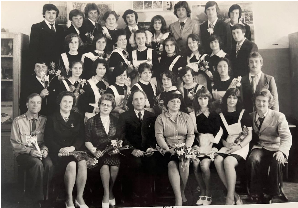
Год 1978 Имя С.М. Горького Парадник