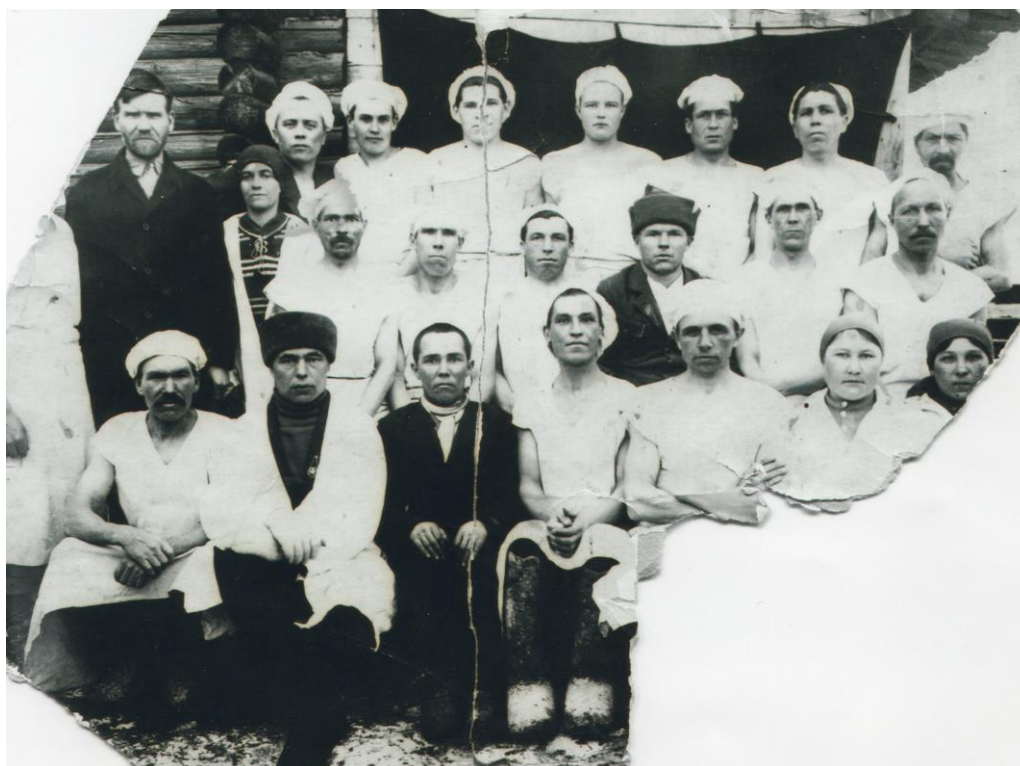
Коллектив Канашского хлебозавода