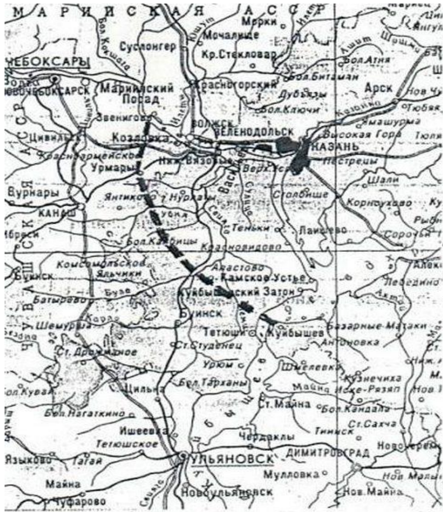
Схема «Казанского обвода»