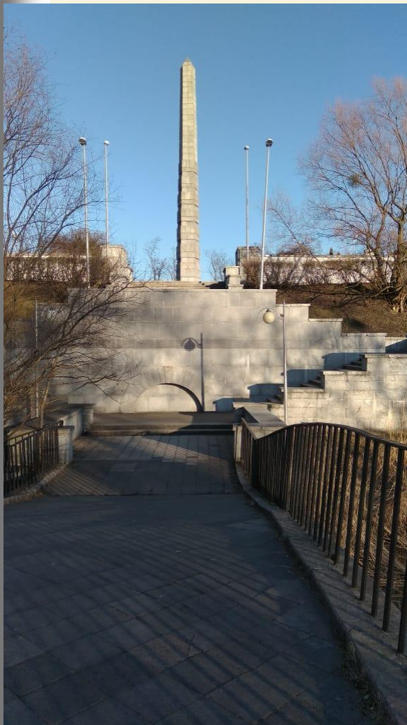
Стелла погибшим в Калининграде

Могилу прадеда мой папа смог найти после рассекречивания документов в 2009 году.